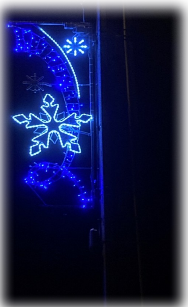
Illumination arrivée Nanteuil