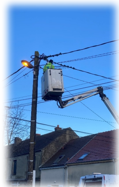
Opération de maintenance d'une lampe